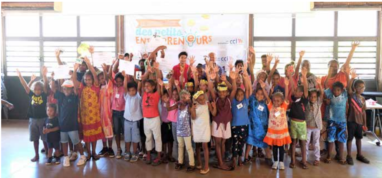
Plus de 1400 enfants inscrits aux quatre éditions des Rendez-vous des petits entrepreneurs et 545 mini-entreprises créées