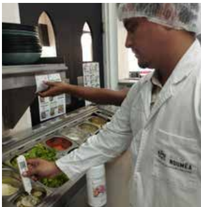
Un agent du service de l'inspection sanitaire des milieux de la Ville de Nouméa en inspection.

Chaque année, les agents de la Ville de Nouméa inspectent plus d'un millier de commerces alimentaires tels que restaurants, débits de boisson, roulottes, épiceries ou traiteurs afin de contrôler la salubrité des denrées alimentaires. Testés durant le second semestre 2023, de nouveaux outils d'inspection sont désormais opérationnels.