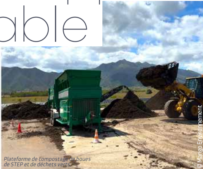
Plateforme de compostage de boues de STEP et de déchets verts