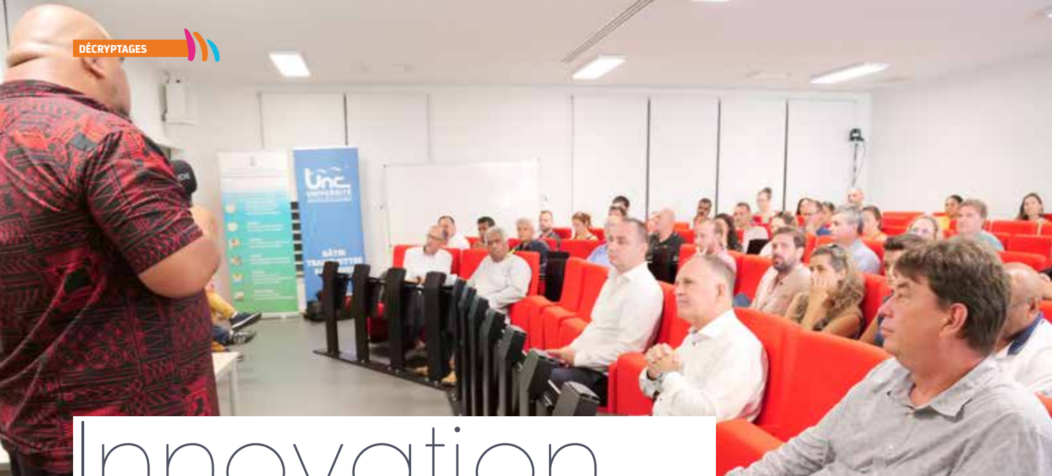
Présentation de la stratégie territoriale de l'innovation 2.0 à l'Université de la Nouvelle-Calédonie.