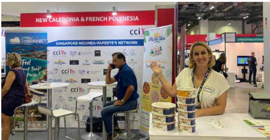
Les six entreprises calédoniennes qui ont participé à la première mission économique exploratoire emmenée par la CCI à Singapour, ont pu nouer de nombreux contacts d'affaires.

La CCI a rempli sa mission d'accompagnement des entrepreneurs sur l'ensemble du territoire à travers des actions fortes notamment pour les guider dans les grandes transitions : numérique, sociétale, environnementale. Elle a poursuivi une démarche prospective et visionnaire pour travailler sur la relance économique au bénéfice de toutes les entreprises.