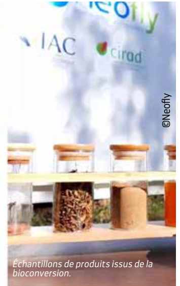
Échantillons de produits issus de la bioconversion.