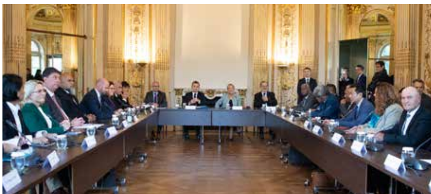
La CCI autour de la table à la Convention des partenaires sur l'avenir de la Nouvelle-Calédonie en octobre 2022.

Fin 2020, les acteurs économiques, dont la CCI, se sont rassemblés sous la bannière commune Nouvelle-Calédonie Économique (NC ÉCO). Objectifs : inclure les enjeux économiques et sociaux dans les discussions sur l'avenir du territoire et proposer un modèle économique et social partagé et pérenne. Les différents travaux du consortium ont fait écho de la Nouvelle-Calédonie jusqu'à Paris et il est désormais un acteur à part entière des discussions sur l'avenir du territoire. Cette volonté de défendre la vision du monde économique au service de tous les Calédoniens s'est également traduite par la création d'Agissons solidaires. Le collectif œuvre pour imposer un prisme entreprise aux réformes fiscales à venir (TGC, IRPP, Ruamm) en associant les acteurs économiques.